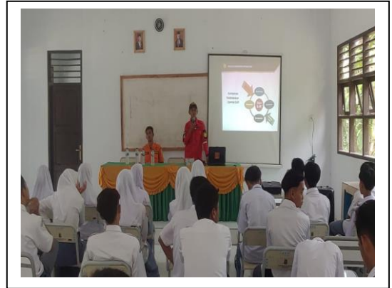
Kegiatan SAR Goes To School, di SMA Negeri 2 Bayah, Lebak, Banten, pada tanggal 25 Juli 2022, jumlah peserta 50 orang.