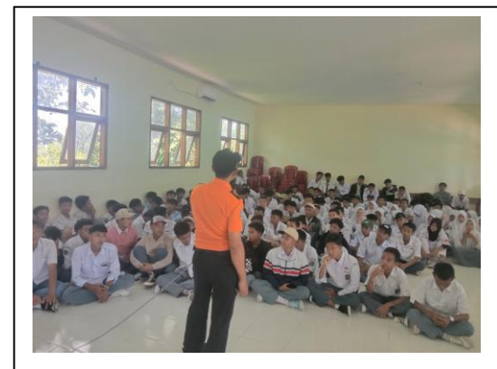
Kegiatan Sosialisasi Pencarian dan Pertolongan, di SMKN 01 Ciligrang, Lebak, Banten, pada tanggal 08 Agustus 2022, jumlah peserta 60 orang.