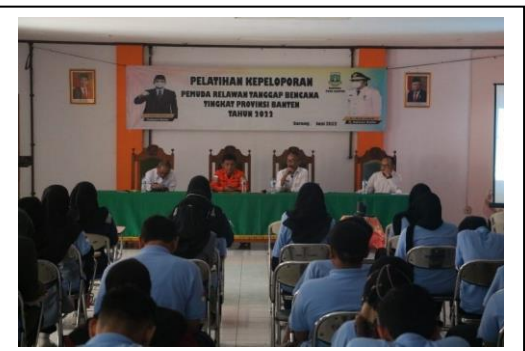
Kegiatan pemberian materi pada Pelatihan Kepeloporan Pemuda Relawan Tanggap Bencana Tingkat Provinsi Banten Tahun 2022, di Kampus IAIB Serang pada tanggal 22 Juni 2022, jumlah peserta 50 orang.