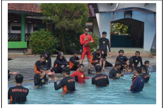
Kegiatan Pelatihan Teknis Pencarian dan Pertolongan di Permukaan Air bagi Potensi Pencarian dan Pertolongan di Wira Carita Hotel, Kabupaten Pandeglang, Banten pada tanggal 23-28 Mei 2022, jumlah peserta 43 orang.