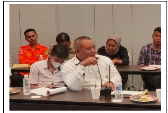
Kegiatan Forum Koordinasi Potensi Pencarian dan Pertolongan (FKP3) Tingkat Daerah Kantor Pencarian dan Pertolongan Banten Tahun 2022, di Aston Cilegon Boutique Hotel, pada tanggal 25 Mei 2022, jumlah peserta 46 orang.