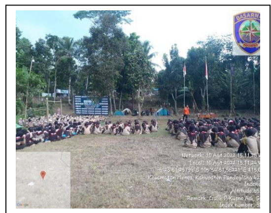
Kegiatan pemberian materi pada Kemah Kebangsaan Gebyar Milad Mathlul Anwar, di Bumi Perkemahan MA Leuwi Panjang, Menes, Pandeglang, pada tanggal 10 Agustus 2022, jumlah peserta 160 orang.