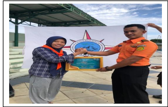
Kegiatan pengenalan Scuba Diving kepada UKM MAZPALA, di Kolam Renang Yonif 320 pada tanggal 30 Mei 2022, jumlah peserta 14 orang.