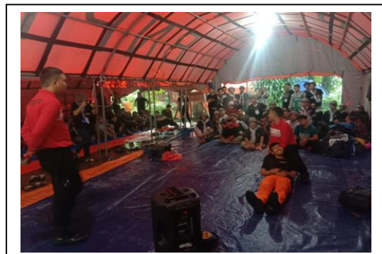
Pelatihan Pelatihan Mitigasi Bencana, di Bumi Perkemahan Pasanggrahan, Carita, pada tanggal 16 Februari 2020 jumlah peserta 160 peserta, asal instansi Rumah Pintar Yatim dan Dhuafa Al Ikhlas.