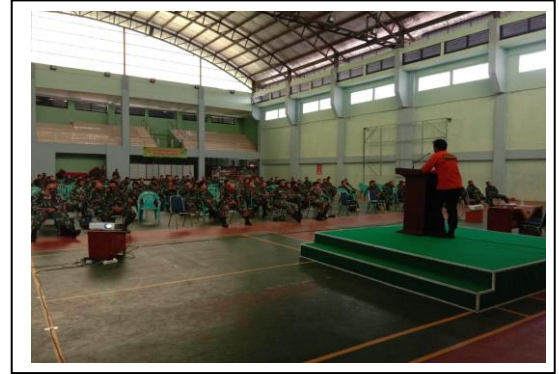
Latihan Penanggulangan Bencana Alam Korem 064/MY TA 2020, pada tanggal 23 November 2020, jumlah peserta 200 orang, asal instansi Korem 064/MY.