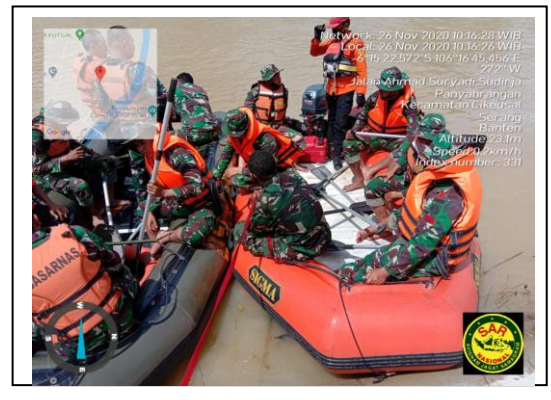
Latihan Penanggulangan Bencana Alam Korem 064/MY TA 2020, pada tanggal 26 s/d 27 November 2020, jumlah peserta 200 org, asal instansi Korem 064/MY.