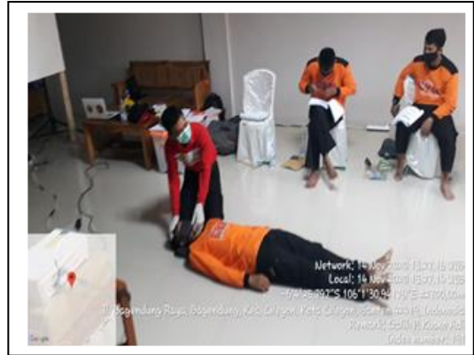
Pelatihan Potensi SAR di Gunung dan Hutan, pada tanggal 14 s/d 20 November 2020, jumlah peserta 24 orang, asal instansi LAZNAS Griya Yatim dan Dhuafa.