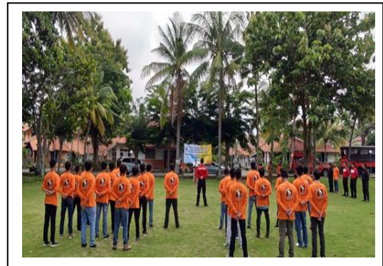
Pembinaan dan Pelatihan Relawan Keterampilan Dasar Relawan Tanggap Bencana “Cekatan” 2020 Desa Cikoneng Kec. Anyar Kab. Serang, pada tanggal 03 s/d 05 Maret 2020, jumlah peserta 30 orang, asal Kelurahan Cikoneng.