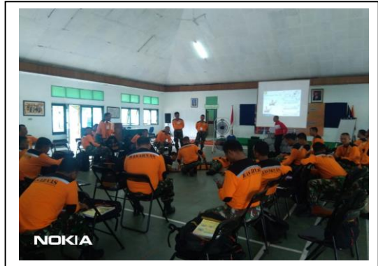
Pelatihan Potensi dengan Dodiklatpur Rindam III Siliwangi pada tanggal 17 s/d 23 Februari 2020, jumlah peserta 60 orang, asal instansi Dodiklatpur Rindam III Siliwangi.