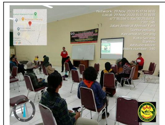
Latihan Gabungan Jungle Rescue SeBanten di Aula UIN Banten, pada tanggal 29 November 2020, jumlah peserta 26 orang, asal instansi MAPALA Se-Banten.