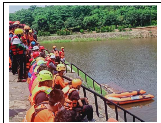
Latihan Gabungan Water Rescue Desk Relawan Banten di Danau KP3B Serang, Banten, pada tanggal 14 s/d 15 November 2020, jumlah peserta 30 orang, asal instansi Sedekah Harian.