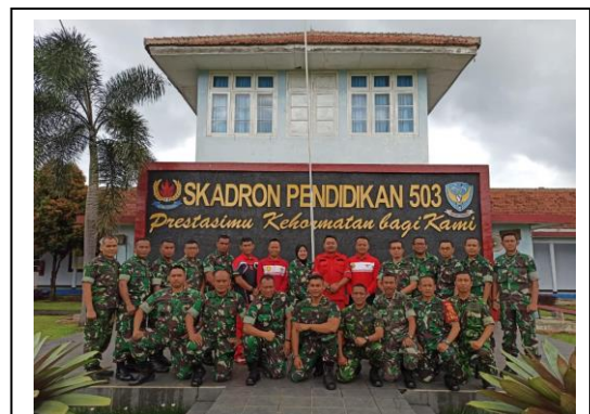
Pendidikan Pengembangan Spesialisasi TNI TA 2020 Bagi Perwira Menengah, Di Skadik 503 Wingdikum, pada tanggal 19 s/d 21 Februari 2020 jumlah peserta 20 orang, asal instansi Skadik 503 Wingdikum.