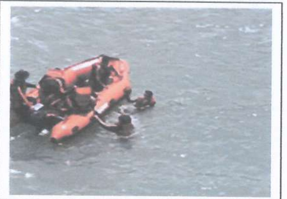
Kegiatan Pelatihan Potensi SAR di Permukaan Air ( Water Rescue ), di Hotel Mangku Putra Merak, pada tanggal 08-14 Desember 2023, jumlah peserta 50 orang.